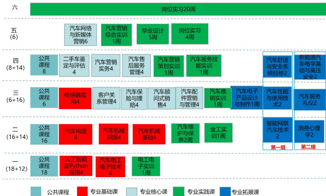
图 1 汽车技术服务与营销专业课程体系图