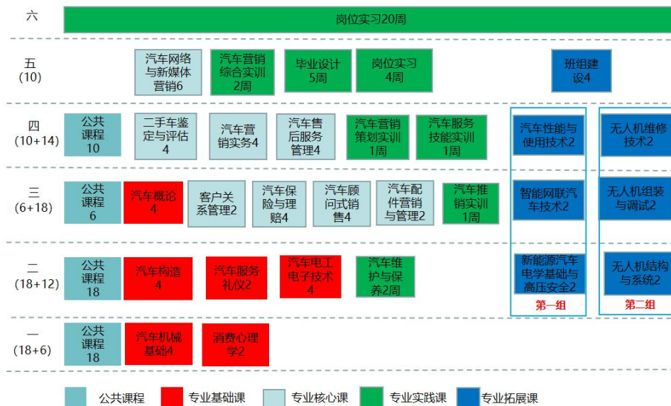
图 1 汽车技术服务与营销专业课程体系图